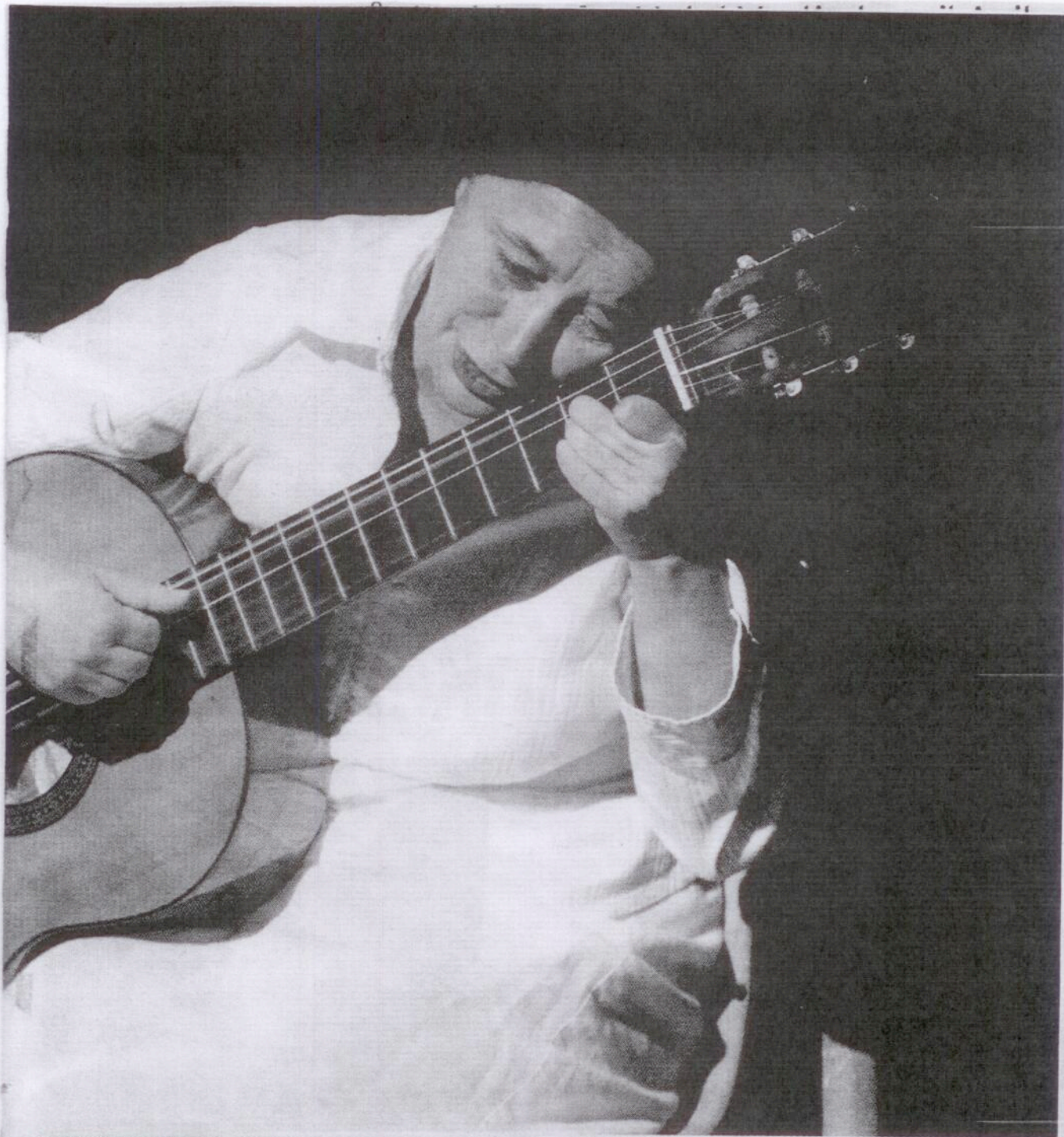
Forestillingen er universel og beskriver gennem sangene alle aspekter af et hverdagsliv som her, hvor hun viser smerten.

ofte er skåret væk fra det øvrige samfund.